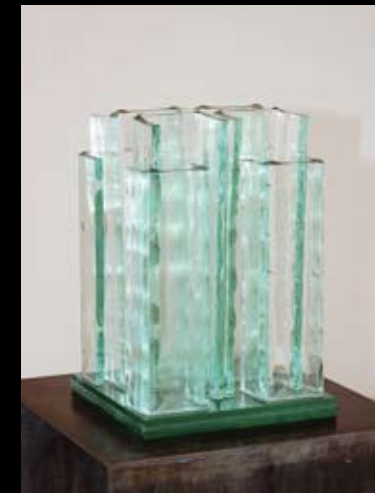
Monika Vosyková Glassculpturen