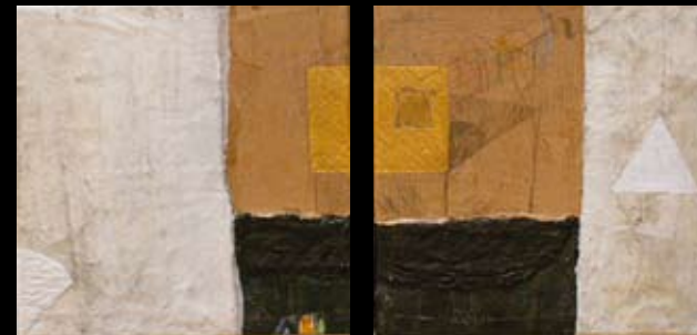
Shabini Mai Schilderijen, mixed media