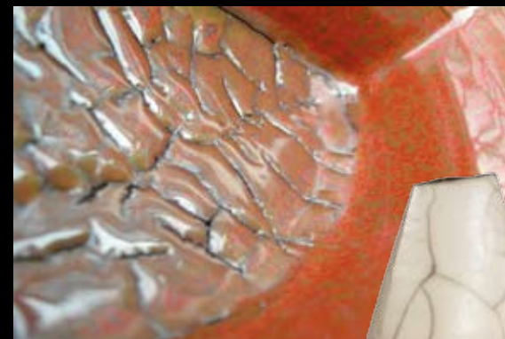
Dirk d'Hoine Keramik