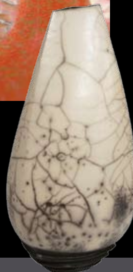
Greet Decoster Keramik