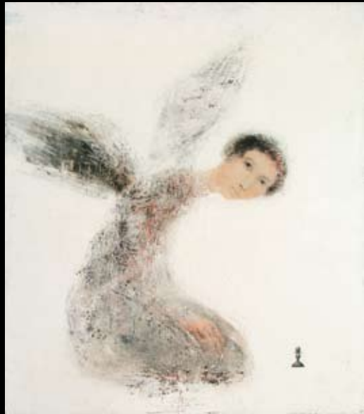
Alexey Terenin Acryl en olieverf op doek