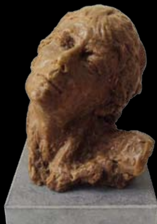
Bernadette Verbelen Brons en polyester